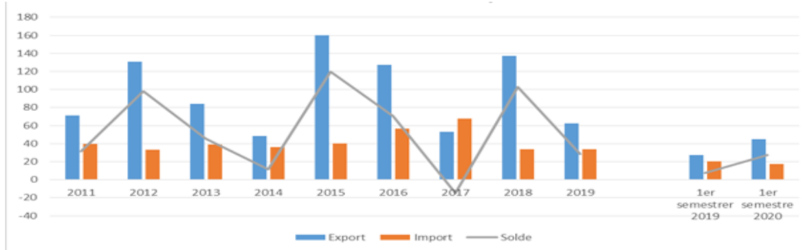
Echanges commerciaux France-Tanzanie entre 2011 et 2019 (MEUR)

Au 1 er semestre 2020, cette réduction se confirme par rapport au 1 er semestre 2019, passant de 20,1 MEUR à 17,6 MEUR (- 12,3 %), sous l'effet d'une baisse des importations d'autres produits industriels : passant de 6,7 MEUR à 1,3 MEUR., soit - 80,1 %.