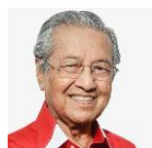
YAB Tun Dr Mahathir bin Mohamad Chairman Prime Minister