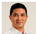
YB Dato Seri Mohamed Azmin Ali Director Ministry of Finance