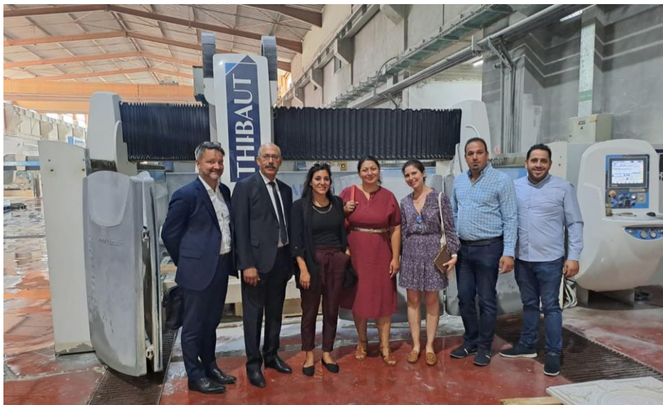
Visite par le service économique de la ZIB (septembre 2023)

Située à 3km de la ville de Bethléem, la Zone Industrielle de Bethléem (ZIB) est née d'un engagement pris au plus haut niveau de l'État français et de l'Autorité palestinienne au cours d'une déclaration conjointe de Mahmoud ABBAS et Nicolas SARKOZY en 2008. La ZIB a reçu une contribution de près de 10 M EUR de la part de l'AFD à la construction des infrastructures nécessaires à son développement.