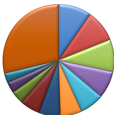
Ventilation du chiffre d'affaires de l'industrie agroalimentaire par sous-secteur (2017)

L'industrie agroalimentaire est le deuxième employeur et le troisième producteur du secteur manufacturier. L'industrie agroalimentaire a connu une croissance soutenue au cours des cinq dernières années, le taux composé de croissance annuelle des exportations s'élevant à 5,6%. L'industrie agroalimentaire est caractérisée par la diversité de ses activités. Les principaux sous-secteurs sont, en valeur, la fabrication de produits laitiers (9,6%), la transformation et la conservation de la viande (9,4%) et la transformation et la conservation de la viande de volaille (9,3%).