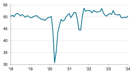
S&P Global ASEAN Manufacturing PMI sa, >50 = improvement since previous month

En ce début d'année, le secteur manufacturier de l'ASEAN a légèrement progressé, comme l'indique l'indice PMI manufacturier de S&P qui est passé de 49,7 en décembre à 50,3 en janvier. Cette hausse, la première en cinq mois, signale une amélioration timide du secteur,