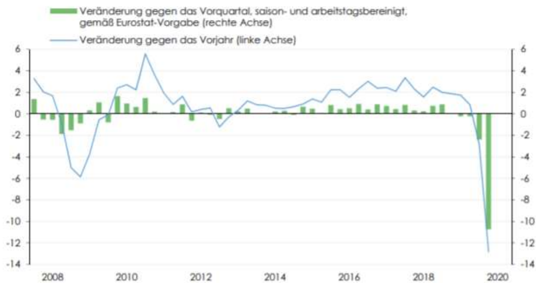
Abbildung 1: Entwicklung des realen Bruttoinlandsproduktes In %