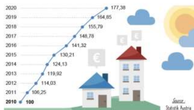
Indice des prix des logements (maisons et appartements)

En 2020, les prix de l'immobilier en Autriche ont sensiblement plus augmenté que les années précédentes : le marché a connu une croissance des prix de +7,6 % en 2020 contre +5,8 % en 2019 et +4,7 % en 2018. Par rapport à 2019, on constate une hausse de +5,7 % du nombre de ventes de logements pour les ménages. Avec le télétravail, les maisons indépendantes ont été plus convoitées (hausse des prix de +8,9 % pour les maisons unifamiliales) que les appartements. Si les prix ont augmenté différemment dans tous les Länder, la demande a été particulièrement forte pour les logements dans les zones rurales (hausse de +20,0 % du nombre de ventes d'appartements à la campagne). Enfin, de janvier à septembre 2020, on constate que cette augmentation des prix (+7,8 %) se situe bien au-dessus de la moyenne UE de +5,0 % (DE : +7,1 %, IT : +2,0%).