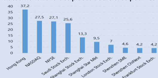
Classement 2019 des places boursières pour les IPO

Réserves fiscales : 113,6 Mds USD (septembre 2020)