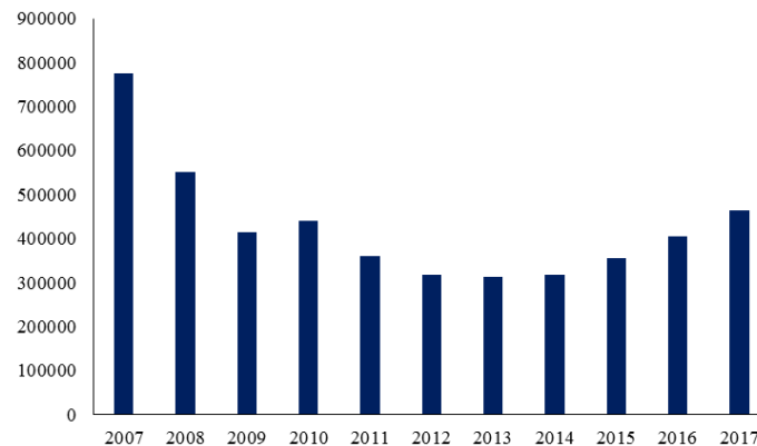
Graphique 2. Transactions de logements en Espagne depuis 2007