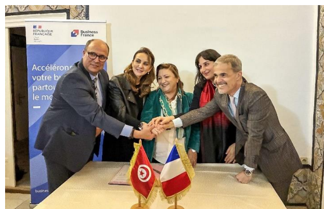
Signature du MoU en présence des représentants de la TAA, la CDC tunisienne et Business France

Le Club IA France-Tunisie animé par Business France a signé trois MoU avec la Tunisian Automotive Association (TAA), le cluster des industries électroniques tunisiennes ELENICA et le cluster MECATRONIC, jeudi 27 novembre 2025, afin d'accélérer l'intégration de l'intelligence artificielle (IA) dans l'industrie automobile tunisienne. Ce partenariat vise à intégrer l'IA au cœur des chaînes de valeur industrielles, favoriser les synergies technologiques tuniso-françaises, mettre en place des passerelles opérationnelles entre startups, institutions, experts et industriels, afin d'impulser d'une dynamique méditerranéenne autour de l'innovation.